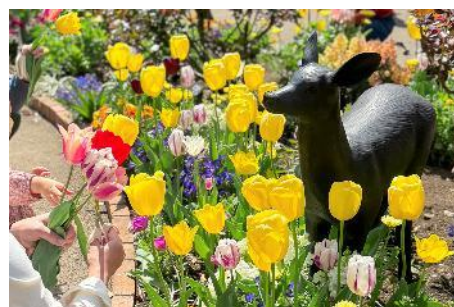
過去の開催の様子