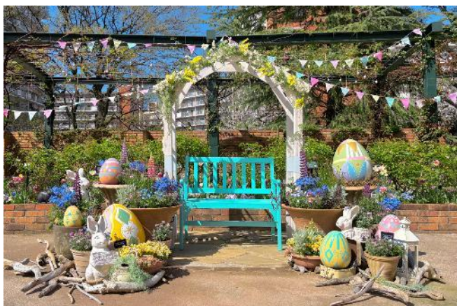
2025年のフォトスポット