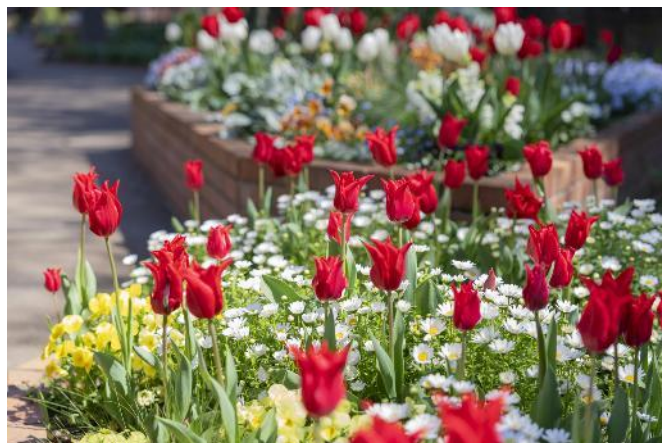
過去の園内の様子

今年も園内では、1 万本を超えるチューリップが 4 月の上旬ごろに開花シーズンを迎えます。第一園芸のガーデナーが厳選し、昨年の品種数を 15 品種超える 84 品種のチューリップが色鮮やかに咲き誇り、春の訪れを華やかに彩ります。