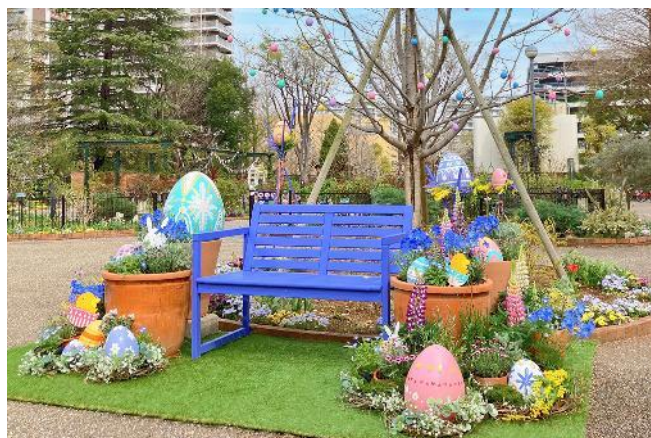
2025年のミニフォトスポット