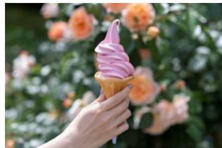
大人気のローズソフト 400円（税込）